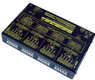
USB-422i-COM4-T5P-ADP 税別価格 ¥ 35,000-