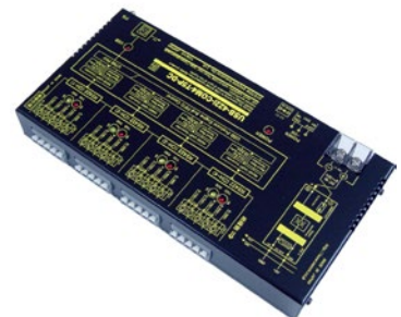
USB-422i-COM4-T5P-DC 税別価格 ¥ 38,000-