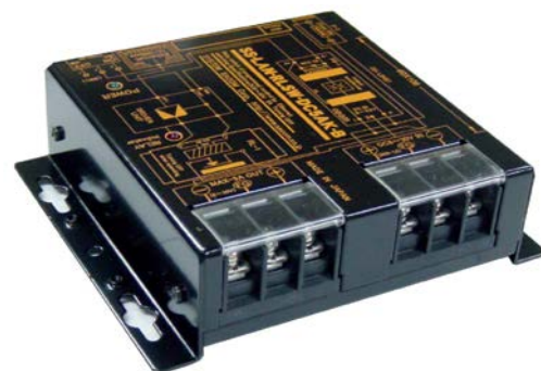
SS-LAN-RLSW-DC5AK-B ¥ 35,000-税別