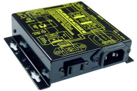
SS-LAN-RLSW-AC10AK-M ¥ 35,000-税別