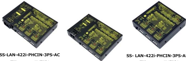
SS-LAN-422i-PHCIN-3PS-AC 価格:63,800 円(税込) (本体価格:58,000 円+消費税)