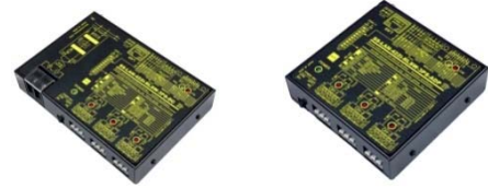
SS-LAN-422i-RLSW-3PS-DC 価格:62,700 円(税込) (本体価格:57,000 円+消費税)