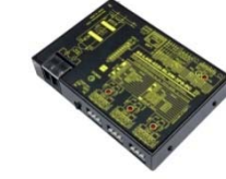
SS-LAN-422i-RLSW-3PS-DC 価格 ¥57,000 (税抜)