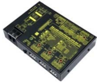
SS-LAN-422i-PHCIN-3PS-DC 価格 ¥60,000 (税抜)