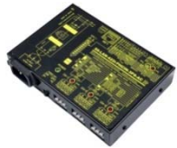
SS-LAN-422i-PHCIN-3PS-AC 価格 ¥58,000 (税抜)