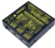
SS-LAN-422i-PHCIN-3PS-ADP 価格 ¥55,000 (税抜)