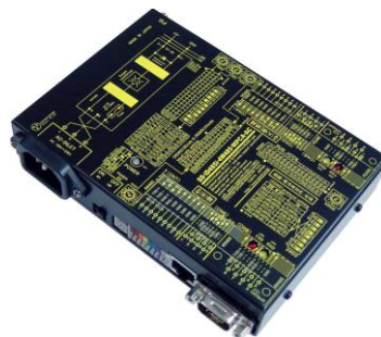
SS-iD4W485i-4W485-WPCA-AC (AC90~240V 電源使用) ¥37,000 (税抜)