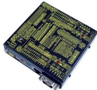
SS-iD4W485i-422-WPCA-ADP (AC アダプター電源使用) ¥35,000 (税抜)