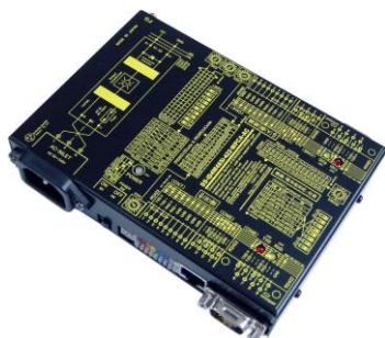
SS-iD4W485i-422-WPCA-AC (AC90~240V 電源使用) ¥37,000 (税抜)