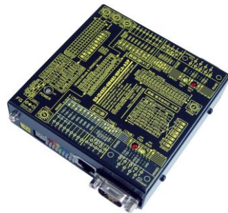
SS-iD485i-4W485-WPCA-ADP (AC アダプター電源使用) ¥35,000 (税抜)