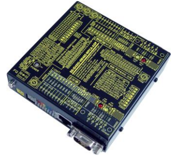
SS-iD485i-4W485-WPCA-ADP (AC アダプター電源使用) ¥35,000 (税抜)