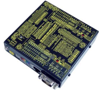
SS-iD485i-485-WPCA-ADP (AC アダプター電源使用) ¥35,000 (税抜)