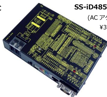
SS-iD485i-422-WPCA-DC (DC8~32V 電源使用) ¥37,000 (税抜)

光絶縁: 通信信号および GND ラインがフォトカプラにより電気的に絶縁されています。