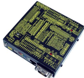
SS-iD485i-422-WPCA-ADP (AC アダプター電源使用) ¥35,000 (税抜)