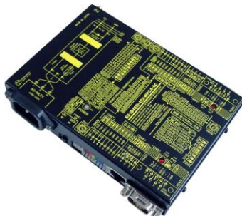
SS-iD485i-422-WPCA-AC (AC90~240V 電源使用) ¥37,000 (税抜)