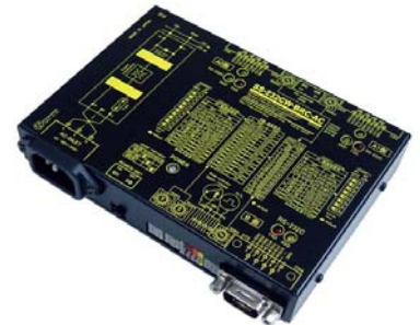
SS-232CW-BRC-AC (AC90~240V 仕様) ¥38,000 (税抜)