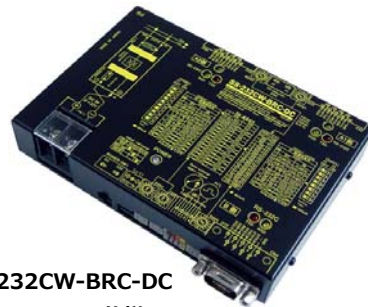
SS-232CW-BRC-DC (DC8~32V 仕様) ¥38,000 (税抜)