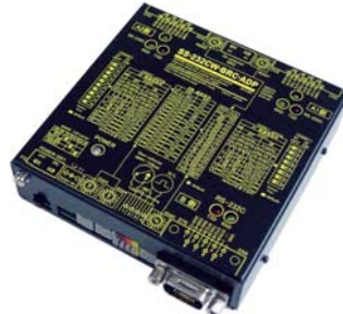
SS-232CW-BRC-ADP (AC アダプター仕様) ¥35,000 (税抜)