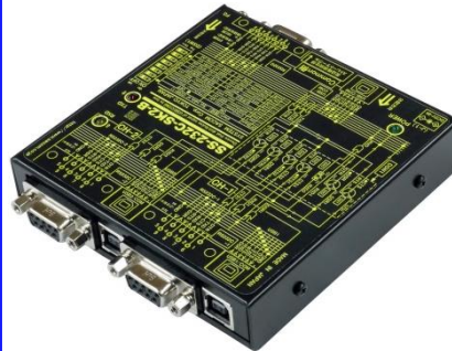
通信組合せについて ② (USBとRS232C両方接続時)