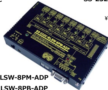
SS-232C-RLSW-8PM-ADP SS-232C-RLSW-8PB-ADP SS-232C-RLSW-8PMB-ADP (AC アダプター仕様) ¥45,000 (税抜)