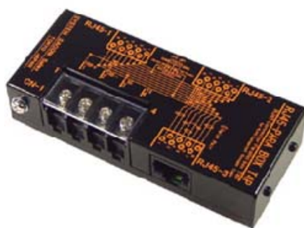
RJ45-PARA BOX T4P