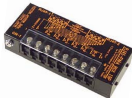
RJ45-PARA BOX T8P